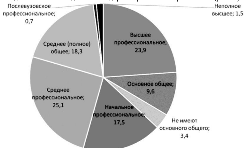
Рис. 2. Уровень образования населения по категориям, % [4]

ванием, так и выпускники техникумов и колледжей. Так, согласно данным Всероссийской переписи населения 2010 года, в стране насчитывалось 83,384 млн человек в возрасте от 25 лет до 64 (общая численность 144,5 млн человек). Из них о наличии высшего образования заявили 27,5 млн, или 33,4%, но это никак не «более половины» от всех, как нередко воспринимают оценку ОЭСР. Общий количественный показатель выпускников высшего образования и среднего профессионального образования делает Россию одним из лидеров в рейтинге стран ОЭСР (рис. 2).