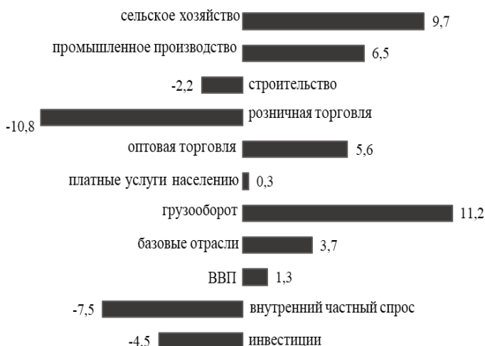
Рис. 1. Изменение основных индикаторов экономической активности 2018 г. к 2014 г., % [3]

инвестиций. По оценкам аналитиков, выйти на докризисный уровень инвестиции при текущих темпах роста смогут лишь в 2020 г., в 2019 г. для обеспечения роста должны увеличиться на 4,7%. Динамика основных индикаторов российской экономической активности 2018 г. к 2014 г. представлена на рис. 1.