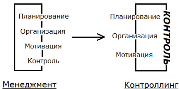
Рис. 1. Переход от менеджмента к контроллингу

Прямым западным (а значит, и более «продвинутым») аналогом («завтрашним днем») китайских и индийских «систем социального кредита (рейтингования)» является так называемый контроллинг (controlling) — термин, который сегодня де-факто уже заменил, вытеснил устаревший «менеджмент». Это понятие прямо указывает на то, что главная характеристика управления сегодня — не то, какие цели оно ставит, а то, как оно их формирует. «Контроллер» (двусмысленное «словечко», поскольку одновременно отсылает и к «контролеру», и к устройству ввода информации в электронной и компьютерной технике и программах) производит не цели, а техники установления целей (рис. 1).