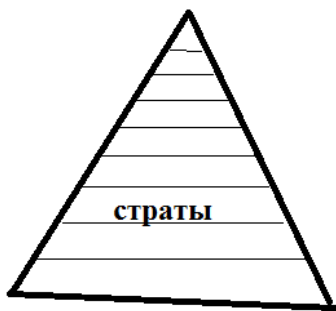
Рис. 2. Форма организации АСП

Возник ли так называемый АСП из развития племенной организации общества или был стадией развития древних обществ, о которых не осталось письменных свидетельств, это был строй, который предшествовал последующей демократической и аристократической организации общества, впоследствии сменившейся буржуазной демократией (рис. 2).