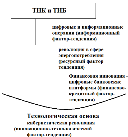
Рис. 4. Факторная структура длинных волн в деятельности ТНК и ТНБ

Принципиальной инновацией в сфере информационного фактора-тенденции стало формирование цифровых платформ. В рамках цифровых платформ [22] внутренним правилом становится планирование, а поведенческим мотивом участников — игра. Налицо явно нерыночные и символические механизмы и мотивы формирования экономического поведения индивидов. Эти мотивы поведения, связанные, как уже было отмечено, с игрой в имидж, с формированием компетенций, добавим еще — и с получением статусной ренты, — характеризуют как раз систему мотиваций стратифицированной деспотии (рис. 2). Это конец рынка однозначно.