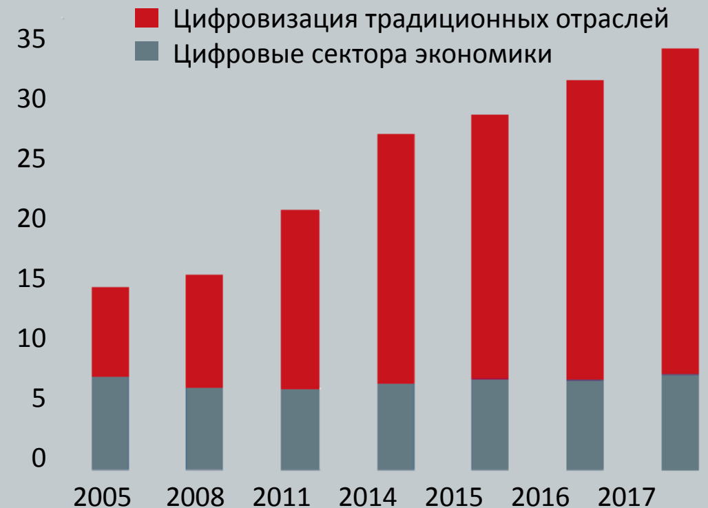
Цифровая экономика Китая * (в процентах ВВП)