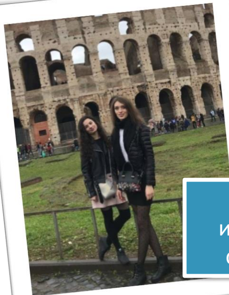
Ездили на иностранные стажировки