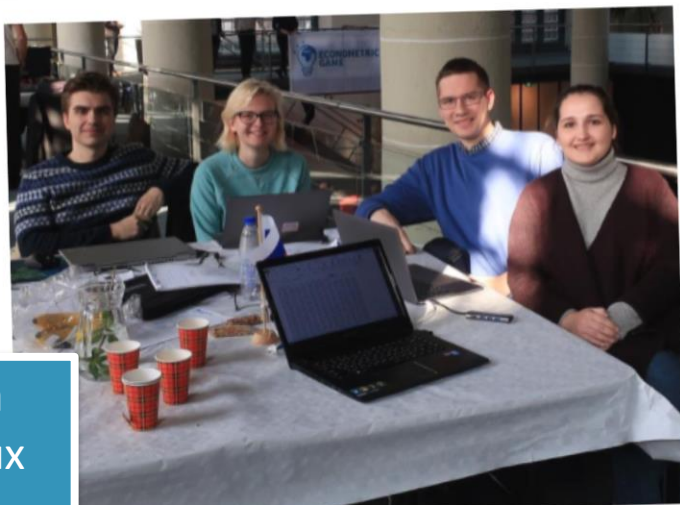
Побеждали на международных олимпиадах