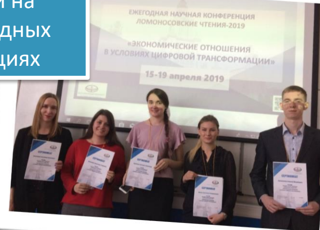
Выступали на международных конференциях