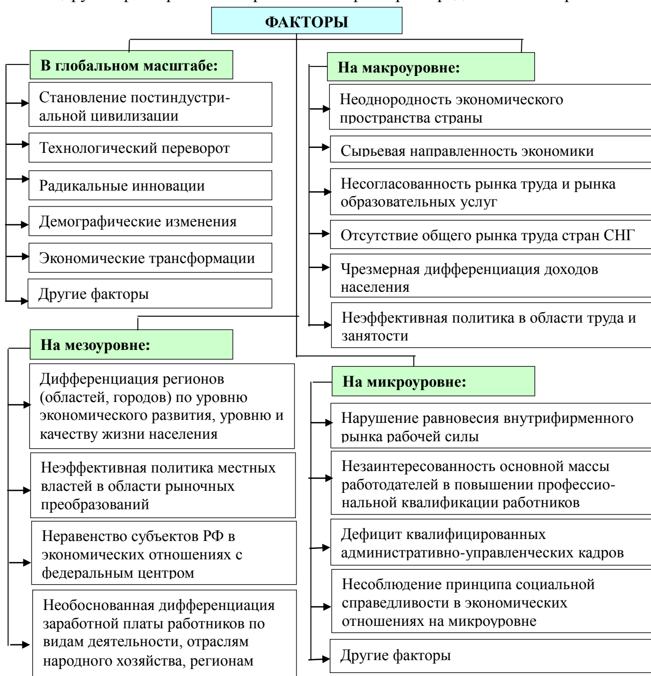
Рис. 1. Основные факторы, влияющие на профессионально-отраслевую структуру

Помимо структурных преобразований, на формирование современной структуры профессионально-отраслевой занятости в России оказывают влияние многие другие факторы. Некоторые из этих факторов представлены на рис.1.