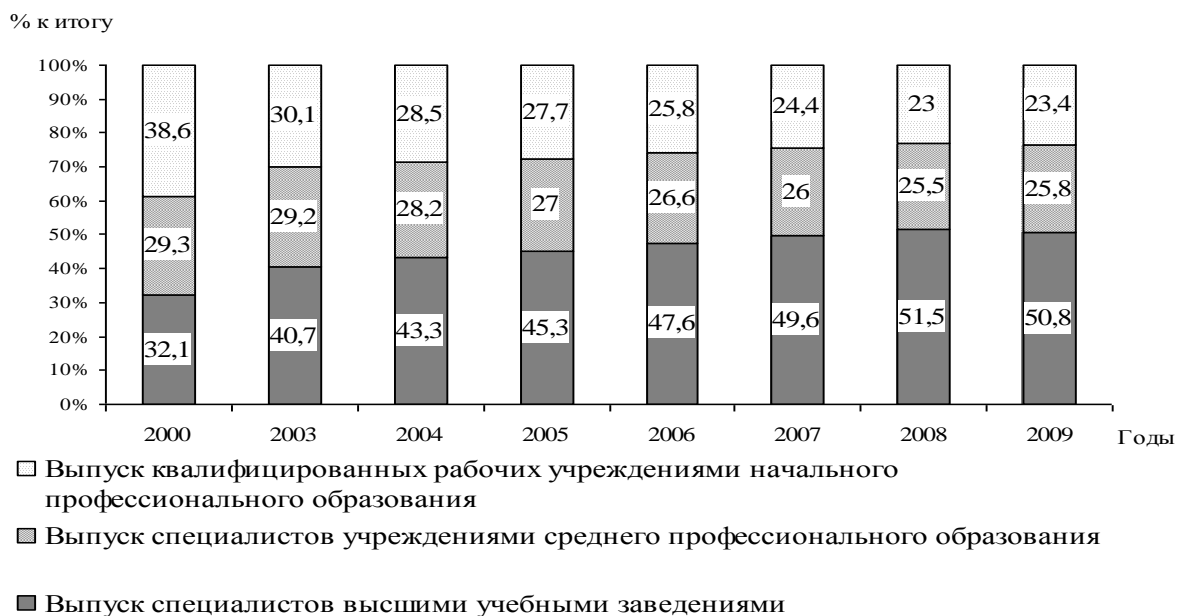
Рис. 3. Число специалистов и квалифицированных рабочих, выпущенных российскими учебными заведениями с 2000 по 2009 гг., в процентах к итогу. 11

Количественное несоответствие спроса на специалистов их предложению усилило существующие диспропорции на российском рынке труда. Кроме того, по мнению специалистов, 10 на российском рынке труда проводится крайне противоречивая политика, которая сдерживает рост безработицы, но не стимулирует занятость, что не приводит к желаемому результату.